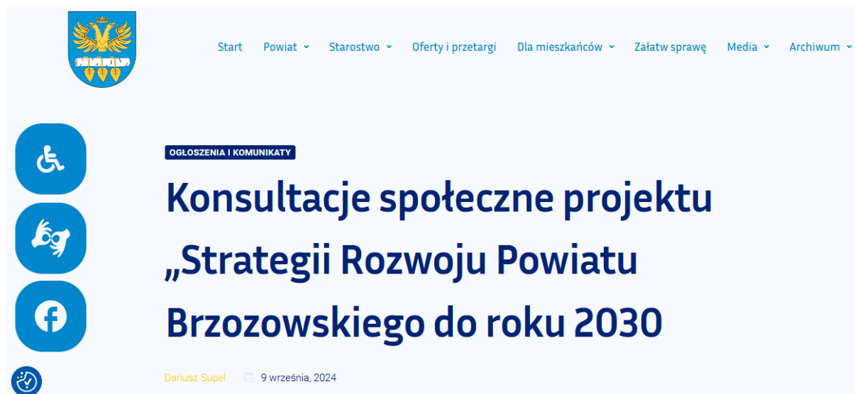
Rysunek 1: Ogłoszenie o konsultacjach społecznych na stronie internetowej Starostwa (nagłówek)